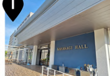
かささぎホール内 1階 売店 (店舗)