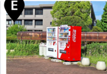
佐賀大学附属図書館 図書館出入口前 (自動販売機)