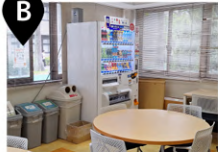
学生センター内 学生ホール (自動販売機)