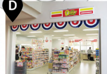
学生会館内 デイリーヤマザキ (店舗)