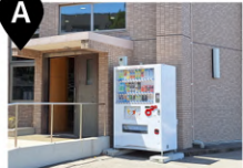
教養教育大講義室 東南出入口 (自動販売機)