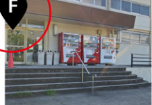
体育館 出入口 (自動販売機)