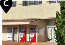
学生会館 東出入口 (自動販売機)