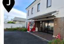
菱の学生会館 出入口前 (自動販売機)