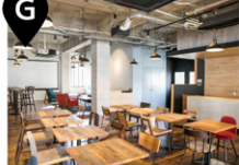
オプティム・ヘッドクォータービル かささぎホール 1階オプティムカフェ(店舗) 東側 (自動販売機)